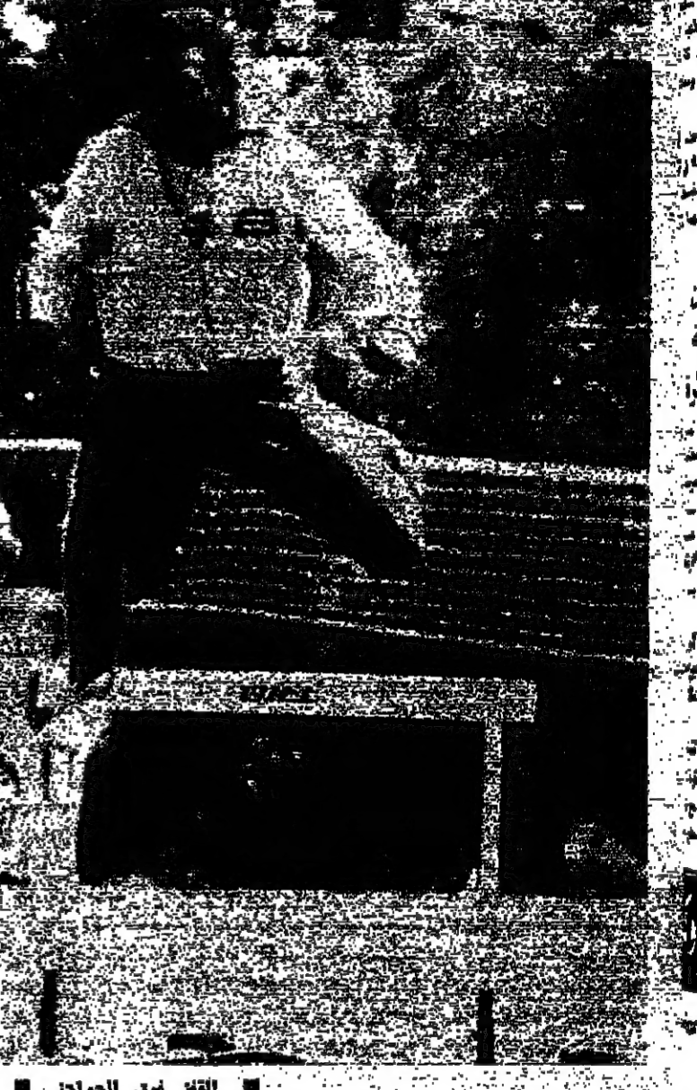
كتبه فكتور نصر

واخذ بنائه في الوقت الذي كان يدير له وجهه كان يبتعد ببطء له .. سترت ابتعاه مختلف في من حشرت .. ● حتى أكثر من ١٠ ثرات أسمع الرمي على خط الأربع الكيلو وسندت مربي الأثر عندنا الطاسي والتقليد دخلت الشباك بجانب التنازل لا .. ● عاد بعدنا وجميع التكرات وراح يعضها امام كل ربح لتسددت التي الرمي بوزنات مختلفة كان يتوسط البعض منها يقف بها نودت جيسة كالتوقع أيضا ونسبنا فعاد التي الرمي بظلمة .. وراش في طار نيسا جانبية وسددها بجانب أخاها وثلاثة ( دول تكه ) بينما ادرس يسأل المستحيل لاقتاد شيت .. وغاب كالمسحوق كالمسحوق غاب من بين عشية وفي لحظة أخذ يركض من خلف الشباك باتجاه سيارته التاكسيات .. انطلقت به كالشمس قبل ان يتم التمسحوق انه ترك القلب بالمثل .. كان ذلك بعد اربعة ساعات في ملعب الجامعة بحدوث نكت حسرة ملتهبه ووجه شمس ..